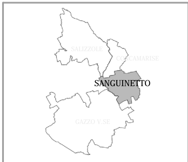
QUADRO D'UNIONE P.A.T.I. BASSA PIANURA VERONESE